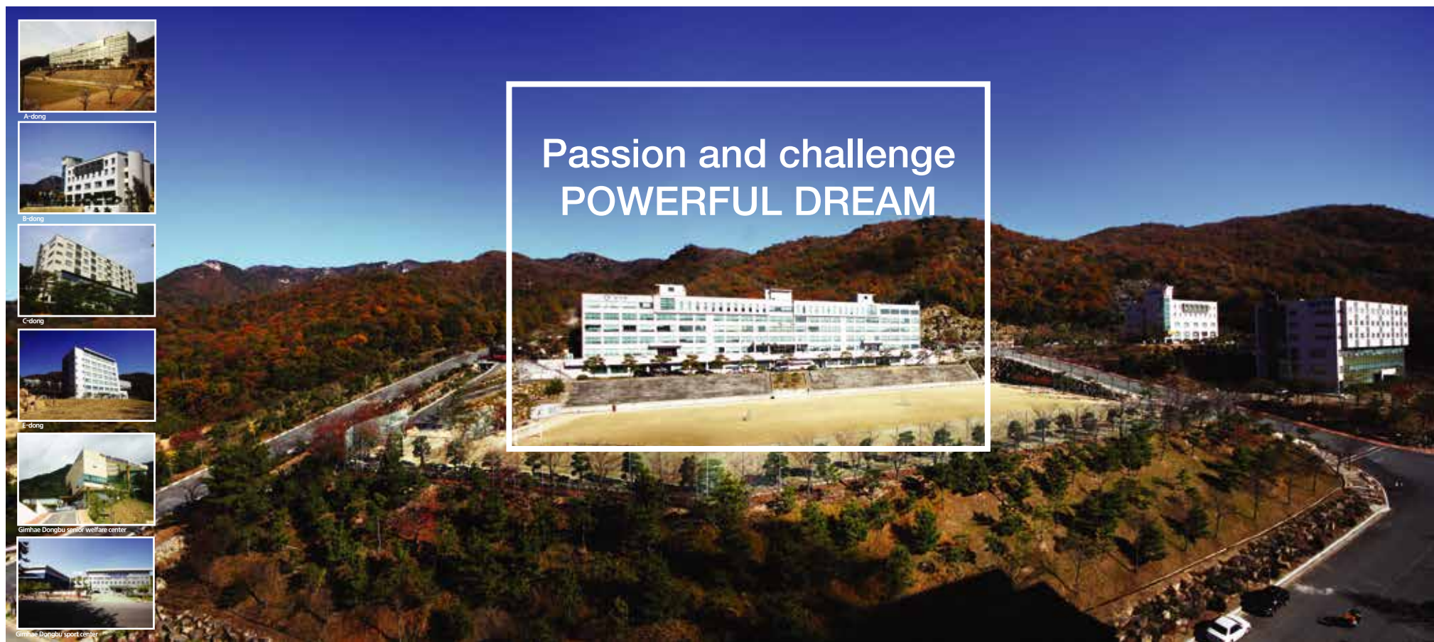
View of campus view from E-dong